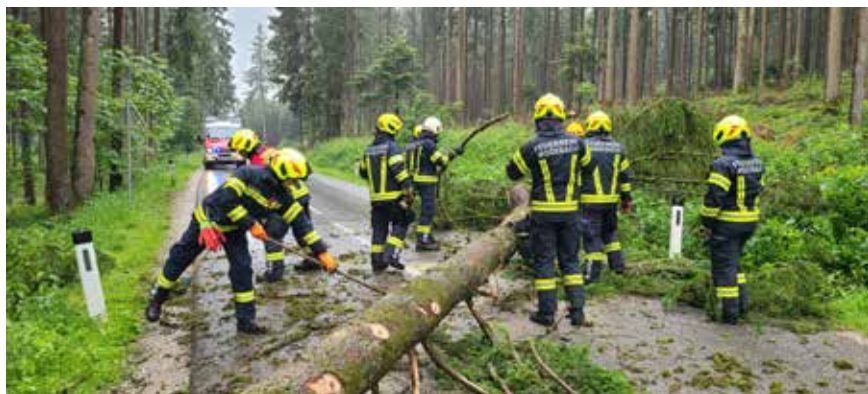
01.06.2024 Baum auf Straße