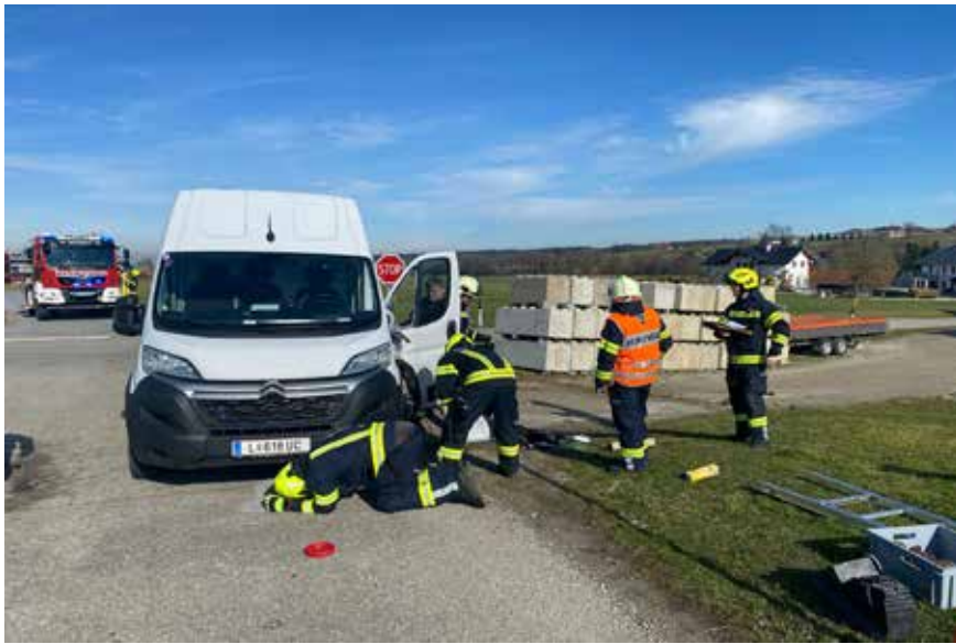
16.02.2024 VU Aufräumarbeiten