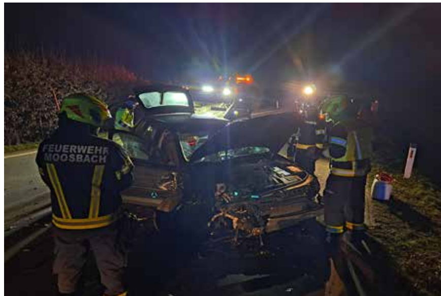
27.02.2024 VU Aufräumarbeiten